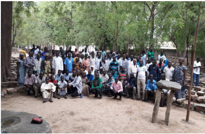
PHOTO DE FAMILLE APRES L'ASSEMBLEE